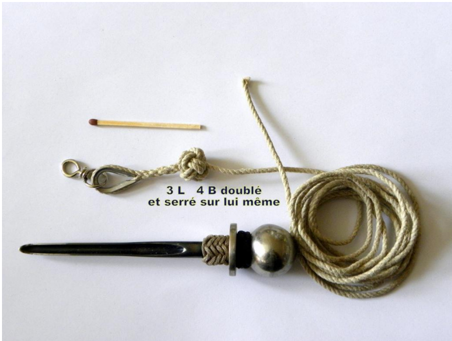
3L 4B doublé et serré sur lui-même