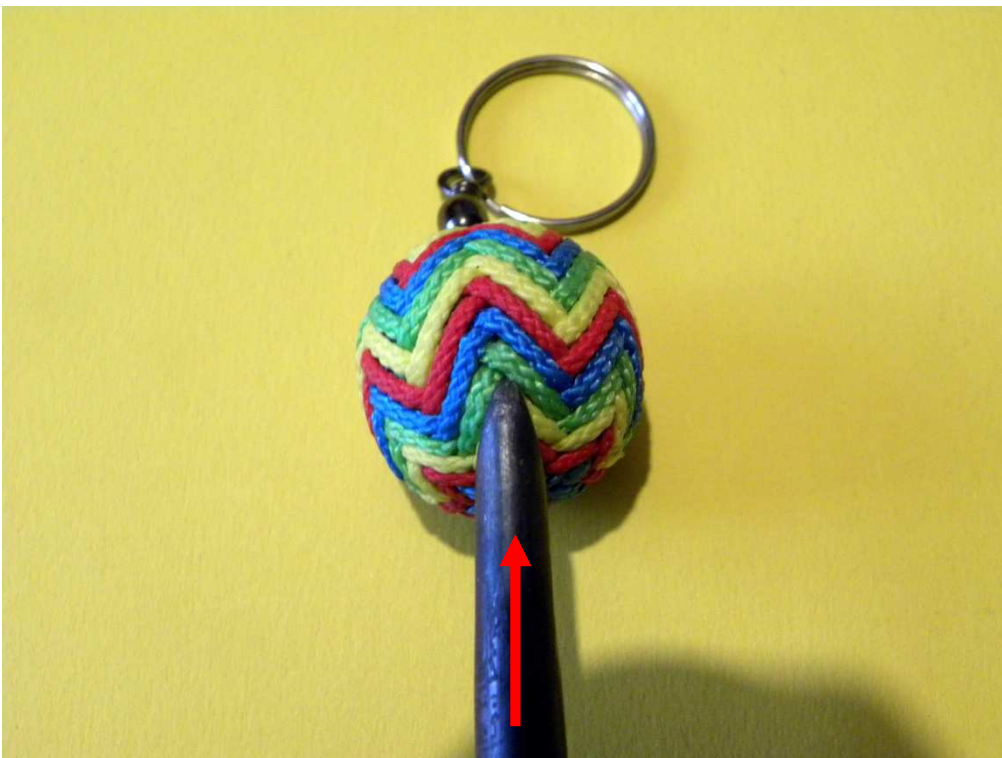
Pousser / push