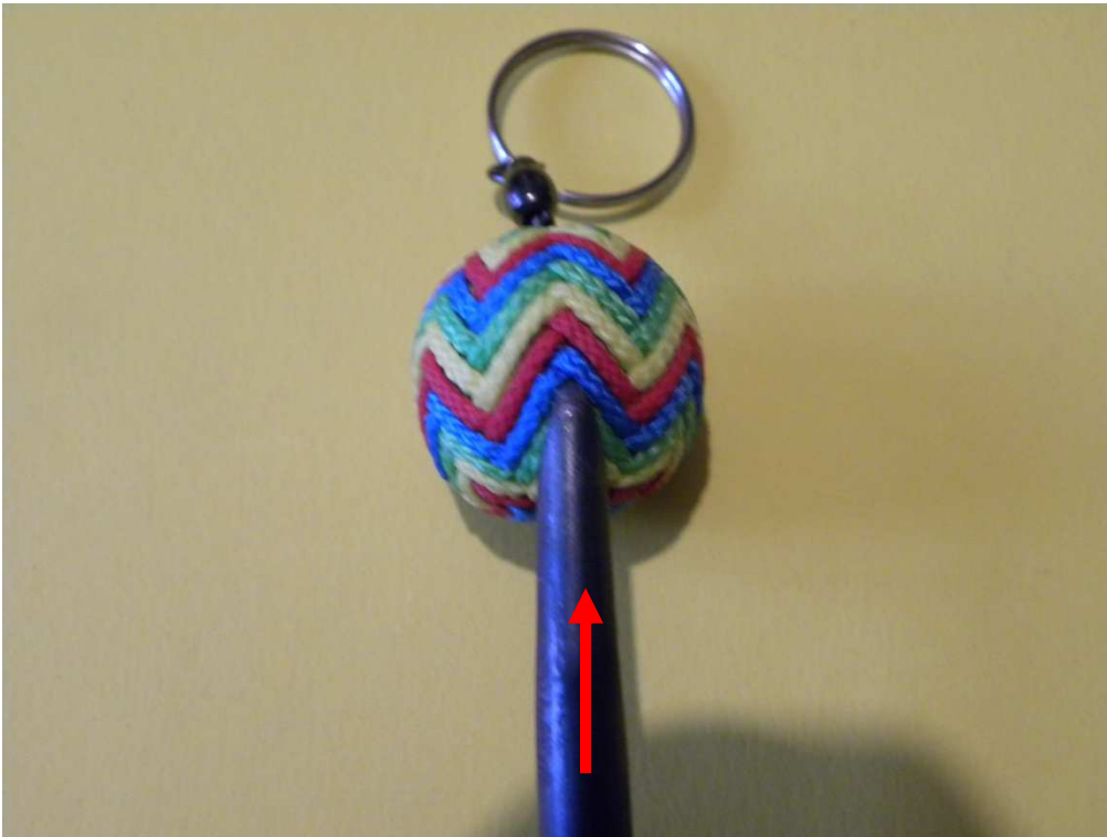
Pousser / push